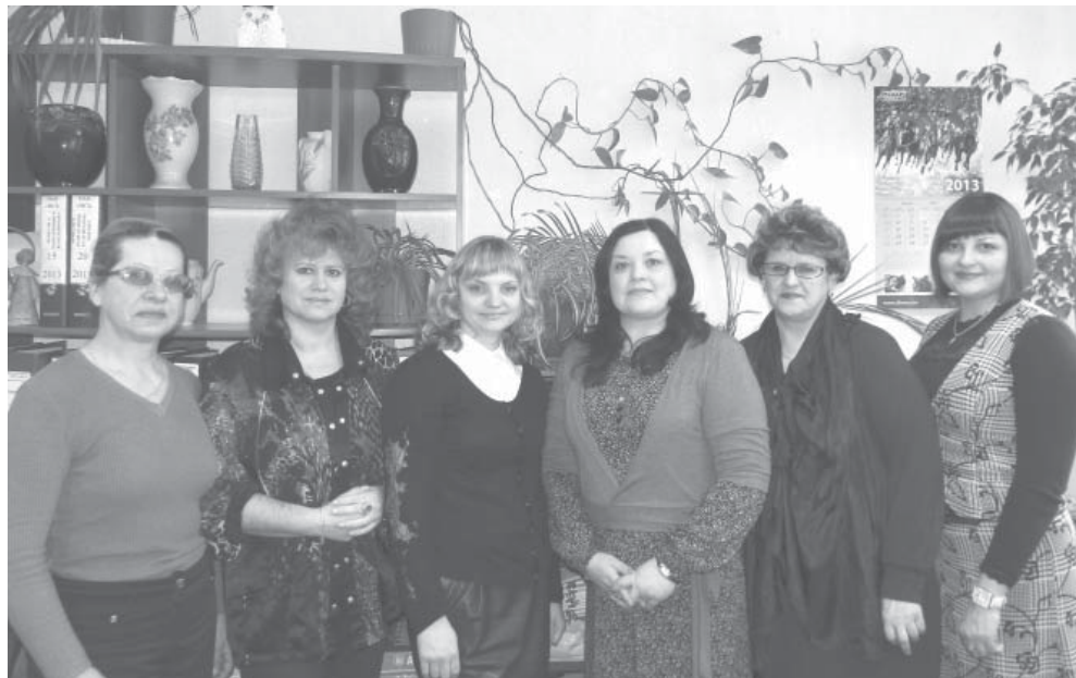
Коллектив организационно-хозяйственного отдела

Круг обязанностей сотрудников этого отдела велик: от уборки помещений заводоуправления, стирки спецодежды для работников цехов, обеспечения подразделений завода типографской продукцией до ведения делопроизводства завода. Стоит еще сказать и о том, что с возникнове-