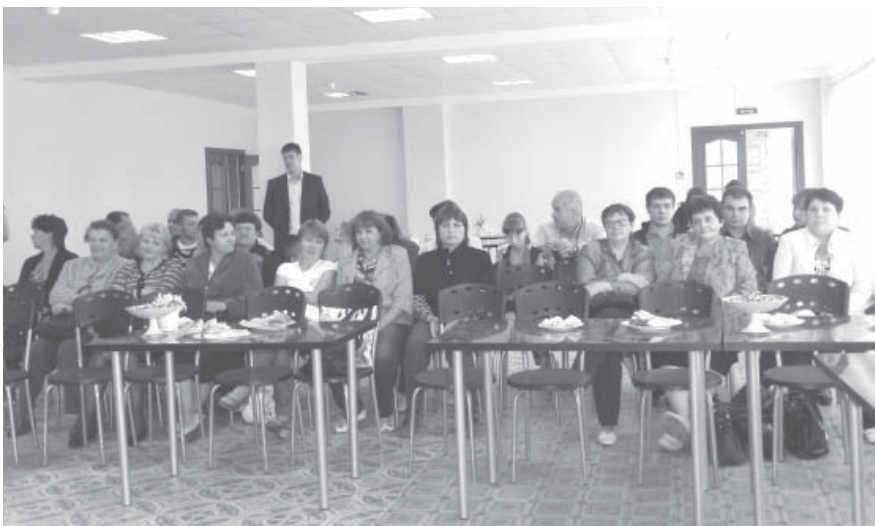
Коллектив механического цеха