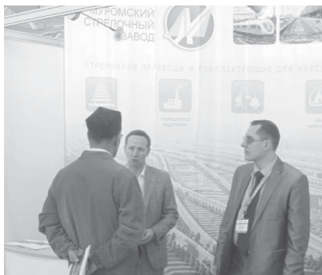
На экспозиции Муромского стрелочного завода

ского стрелочного завода, то одним из них является продолжение активной выставочной деятельности, благодаря которой бренд