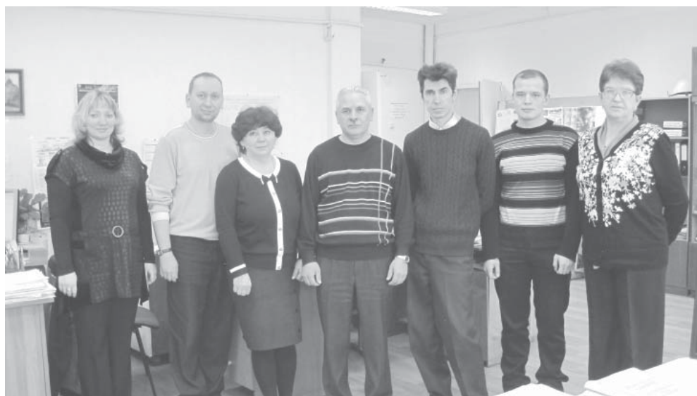
Коллектив отдела главного металлурга

циалисты отдела активно внедряют выпуск отливок высокомарганцовистого литья